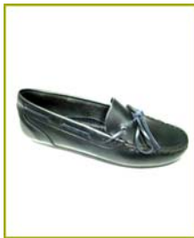
7795 BC Azul marinho

Está autorizada a utilizar o rótulo Biocalce Básico, em calçado de criança de acordo com as especificações expressas no boletim de ensaios: CQ-747/2008 de 22/09/2008 para o seguinte artigo: